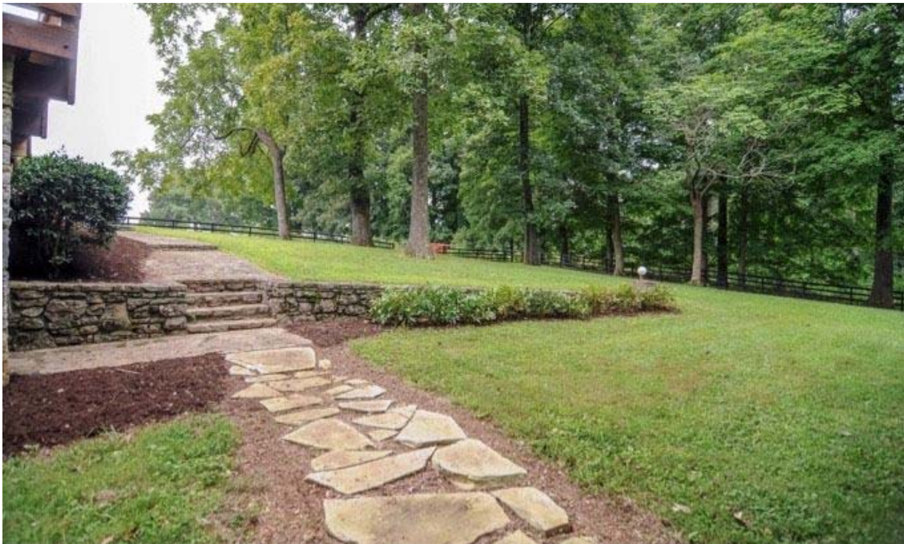
即可停车，也可举行露天舞会