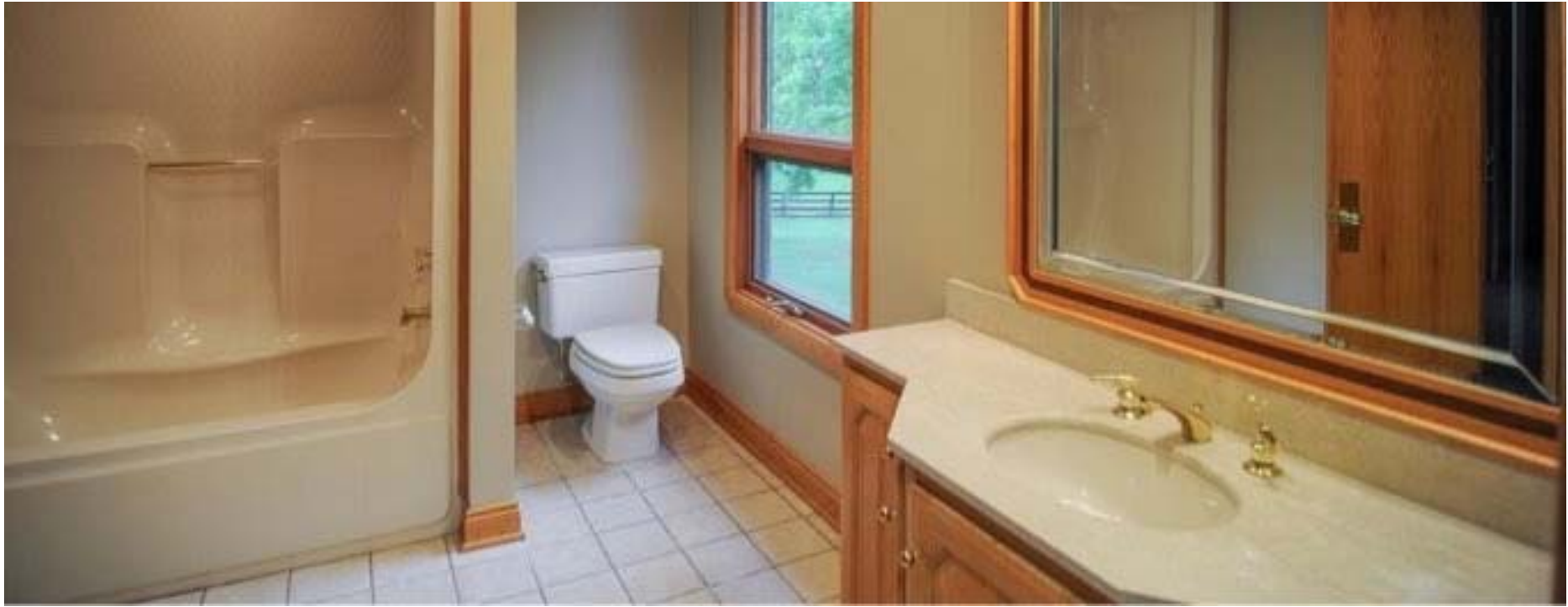
二楼卫浴设计独特的天窗，完全自然采光，相当环保