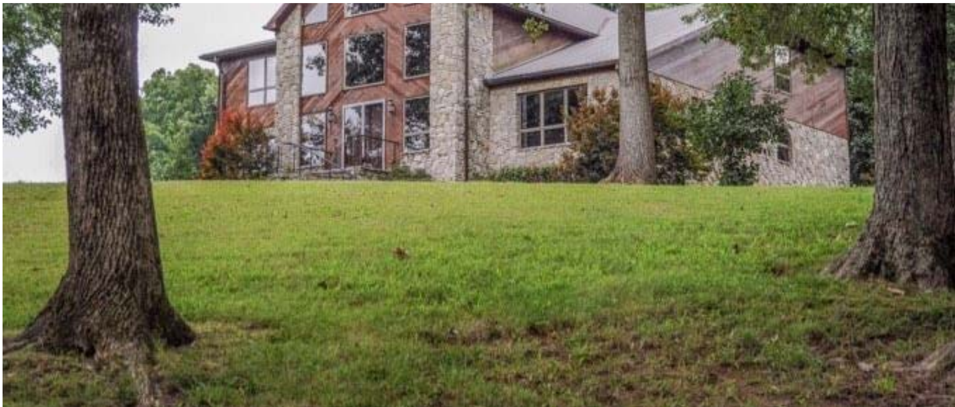
近睹农庄别墅---高挑大窗，采光极佳