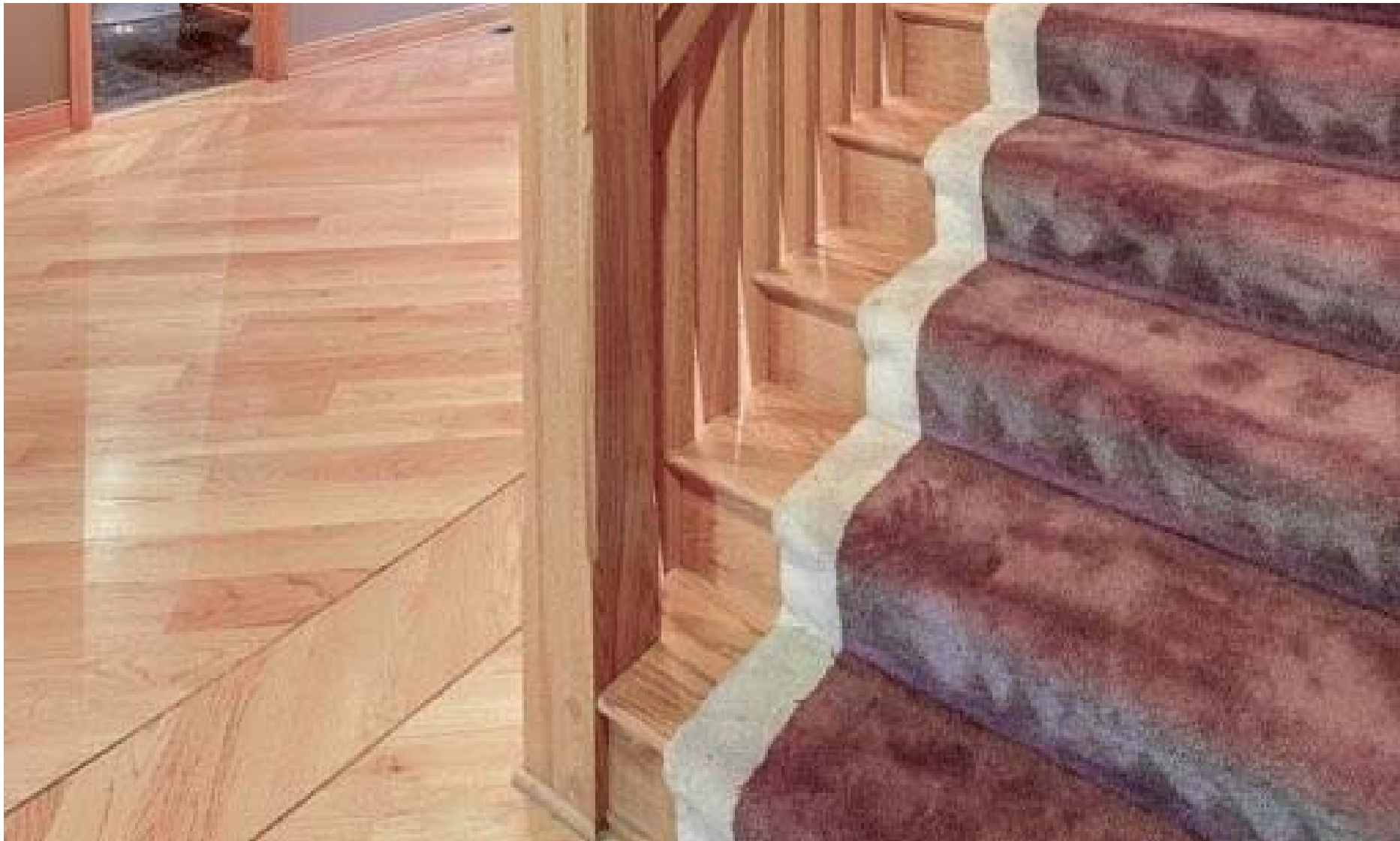
设计独特的二楼回廊