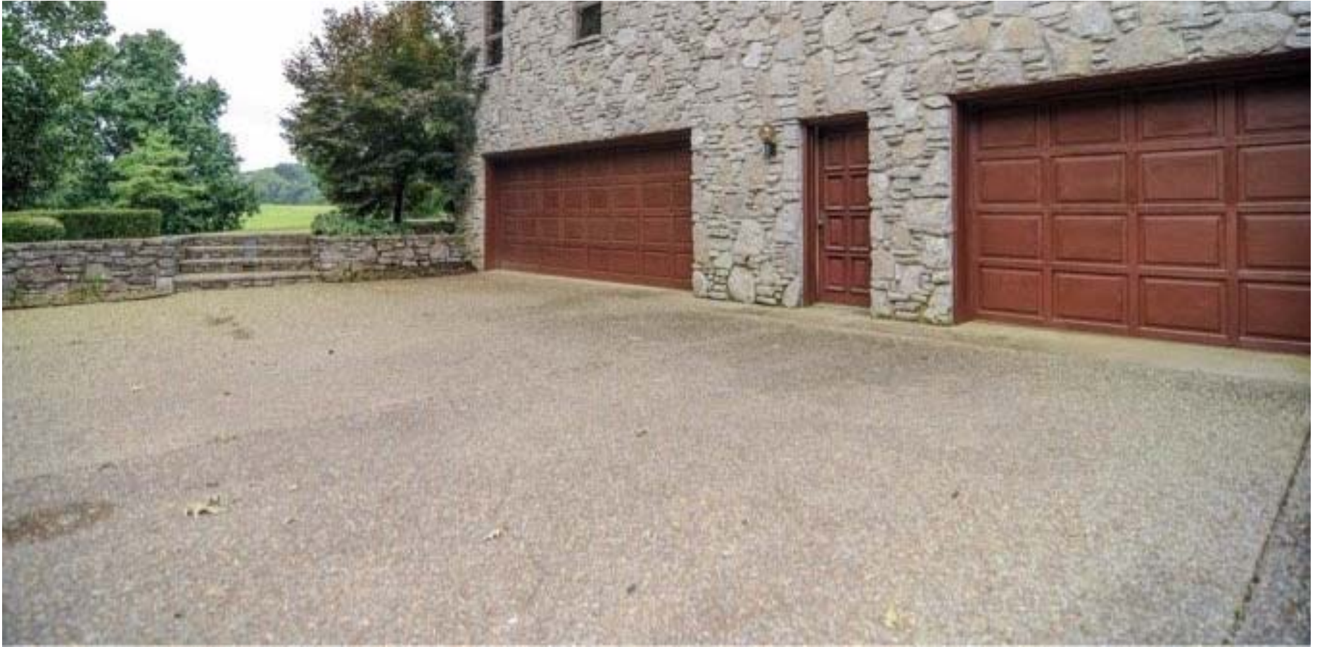
迂回曲折的车道，极具隐私