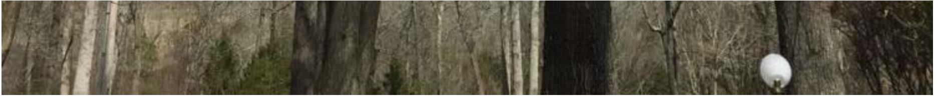
户外露台--独享个人空间，亦或是宴请宾客的好地方